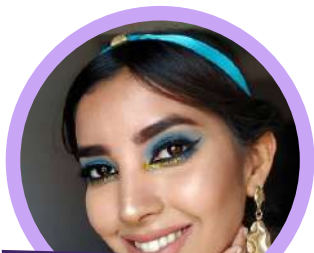
Taller de Maquillaje