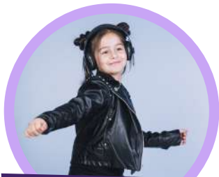
Animación a diario