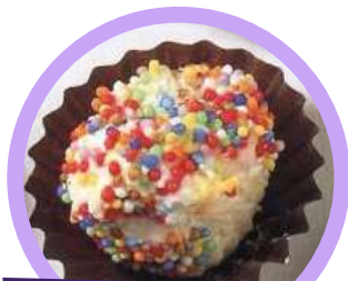
Taller de Cocina