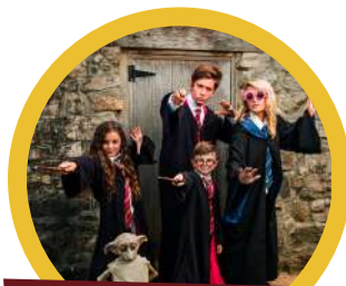
Fiesta de Disfraces