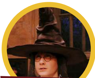
Ceremonia de selección