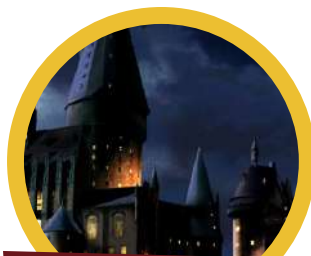
Escape Room Hogwarts