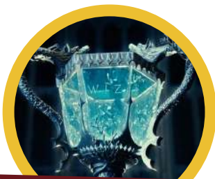
Torneo 3 Magos