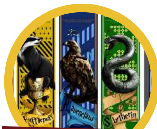
Guerra de Casas