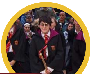
Animación a diario