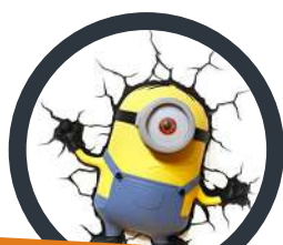
Diseño en 2D y 3D